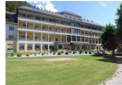
Cliniques GE Joli-Mont et de Montana