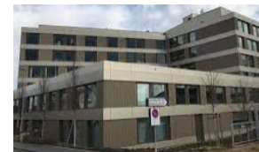
HFR - Meyrier