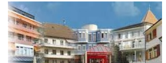
eHnv Chamblon et Orbe