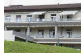
Hôpital de Lavaux