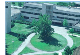
Institution de Lavigny