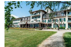
Clinique de la Lignière